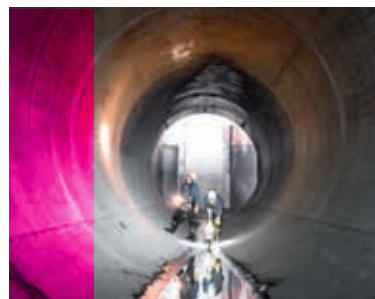
LE COURS XAVIER ARNOZAN ET LE QUAI DES CHARTRONS