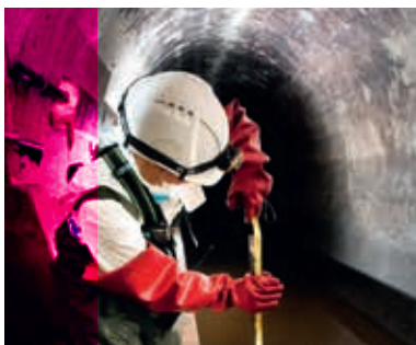
LE COLLECTEUR DES QUAIS

Poursuivant par le quai de la Douane, nous découvrons le miroir d'eau devant le Palais de la Bourse. Cet espace de détente apporte une fraîcheur appréciable en été. Sur le fleuve un ponton flottant appelle l'accostage des bateaux de tourisme en plein centre ville.