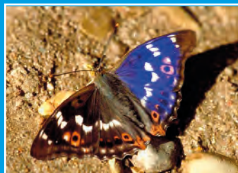
Petit mars changeant