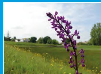
Orchidée à fleurs lâches