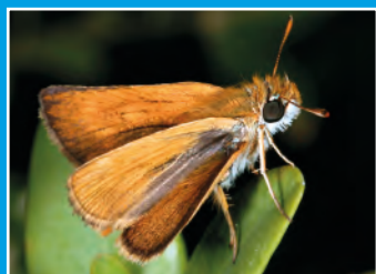
Hespérie du chiendent

L'année a été marquée par des conditions météorologiques défavorables avec des températures plutôt basses et un ensoleillement assez faible, ce qui influe fortement sur l'activité des espèces. De ce fait, même si le nombre d'espèces n'a pas changé, le nombre d'individus par espèces est plus faible qu'en 2020. Cependant, de nouvelles espèces d'intérêt ont fait leur apparition comme le Gobemouche gris ou l'Hespérie du chiendent, un papillon peu fréquent en Gironde. De plus, une nouvelle espèce végétale a été découverte : l'Urticulaire citrine.